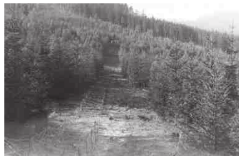
Ilustrační dobové fotografie z jiného úseku (průseky)