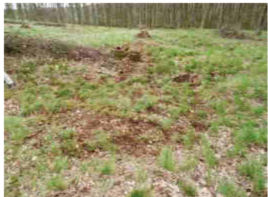
Výkop objektu č. 6079 (A-180)