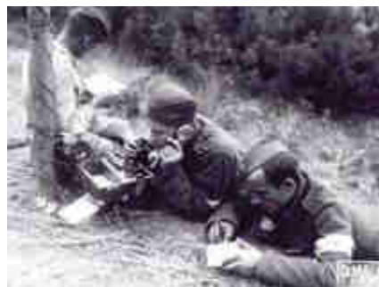
Cvičení spojařů v terénu

Projekt dále zahrnuje instalaci polních telefonů do obou objektů muzea a propojení objektů a provizorního postavení telefonním kabelem.