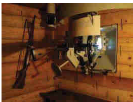
Objekt č. 6084 (hlavní objekt muzea A-140)