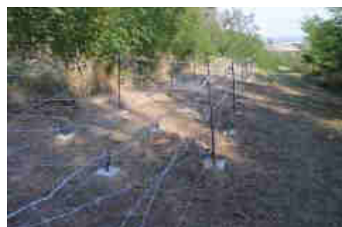
Fotografie z ukončené první etapy