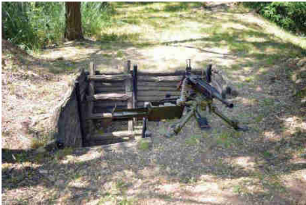
Provizorní postavení pro těžký kulomet