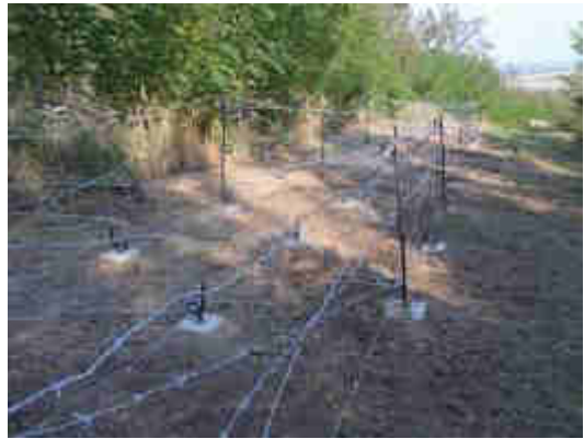
Intervalová stálá protipěchotní překážka