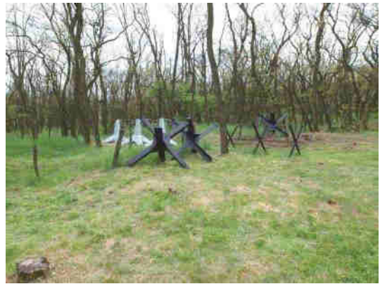
Intervalová překážka (dočasná)