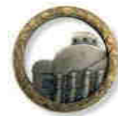
Znak ředitelství opevňovacích prací (ŘOP)

Cíle pro rok 2017: - Popis překážkového systému Cíl projektu: Webové prezentace muzea rozšířena Ukončení projektu: 12/2017