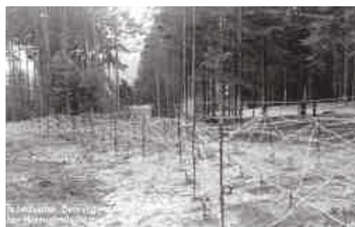
Ilustrační dobové fotografie z jiného úseku (dvouřadá stálá překážka)