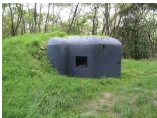
Objekt č. 6083 (ukázka poválečné reaktivace objektů A-120)