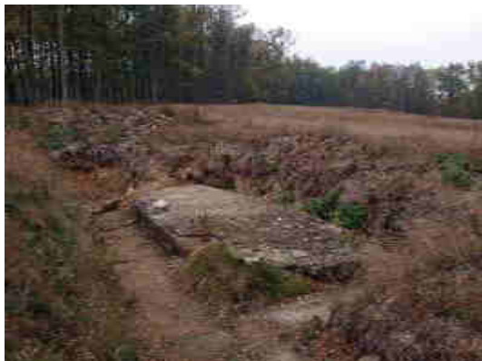
Základy objektu č. 6080 (A-200)